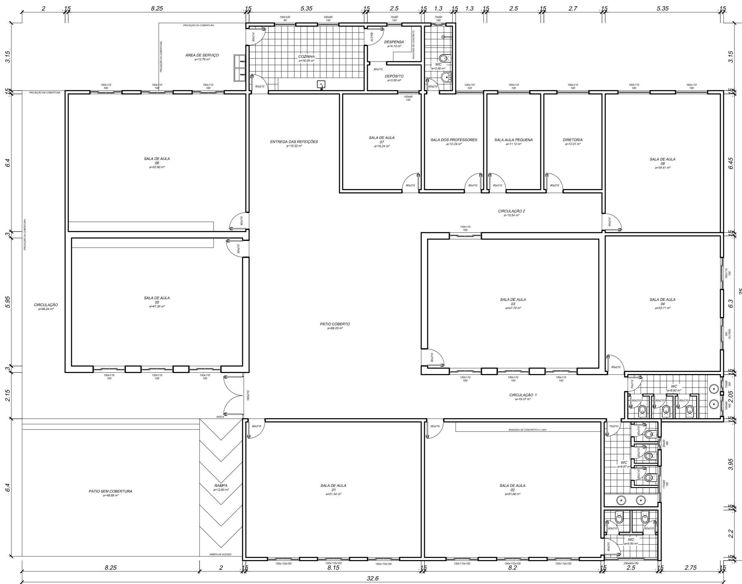
PLANTA BAIXA - BRAÇO DO SUL ESC.:1/100