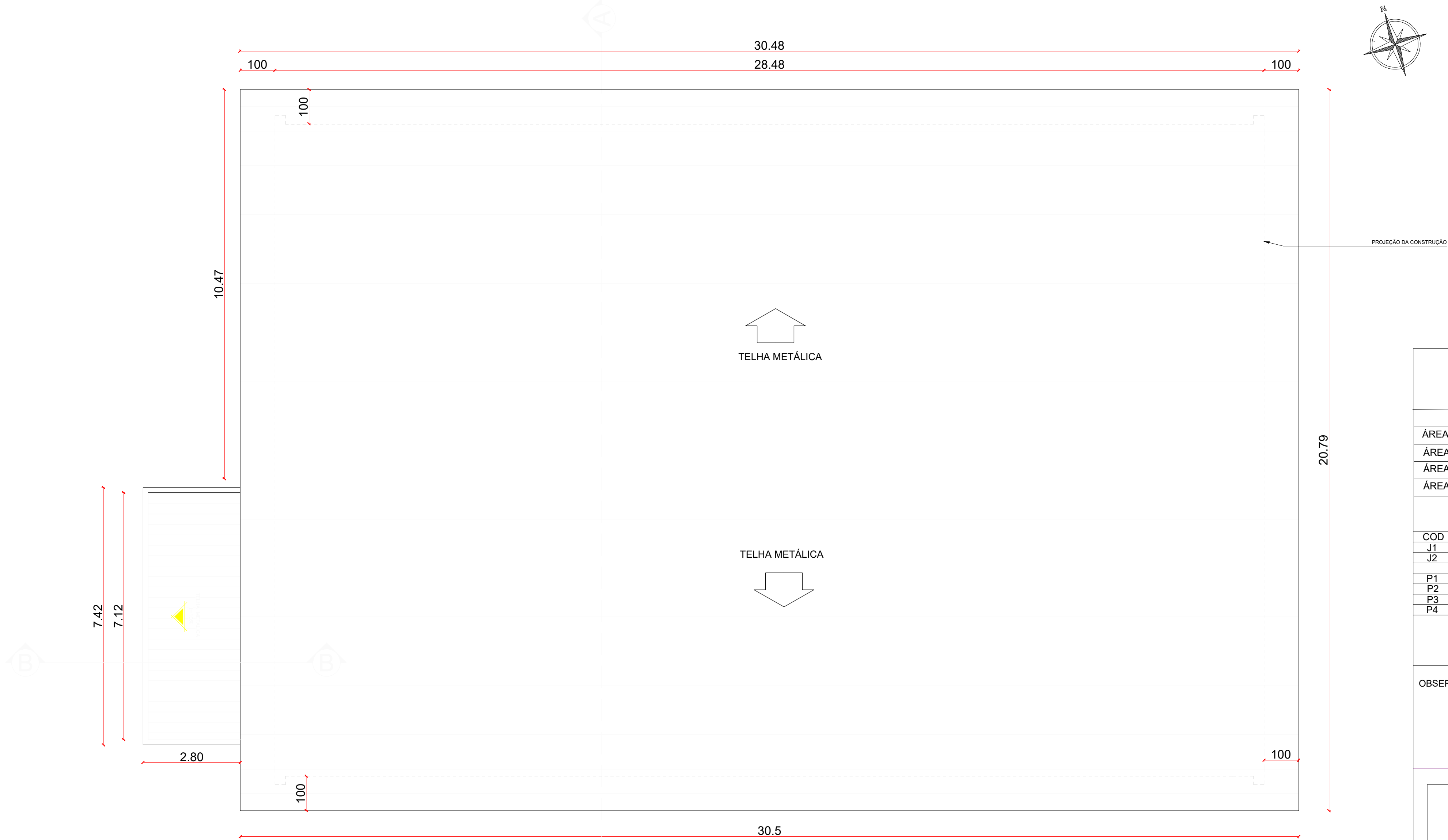
PLANTA DE COBERTURA ESC. 1/75 OBS.: VER PLANTA DE ESTRUTURA METÁLICA